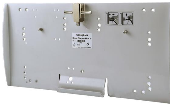
Base Station Mini II (WM8164)

Im Fahrzeug darf die Tragehalterung ausschließlich nur mit der Wandhalteplatte Haltestation Base Station Mini II (WM 8164) der Firma Weinmann verlastet werden.