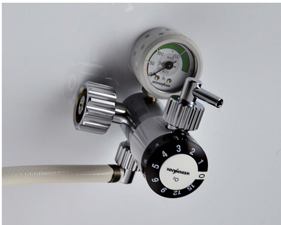
Modul Oxygen mit Winkeltülle zum direkten Sauerstoffanschluss eines O 2 Schlauches zum Patienten.

Für den Zusammenbau der O 2 Einheit übernimmt der Hersteller der TRANSPORT BRACKET keine Haftung.